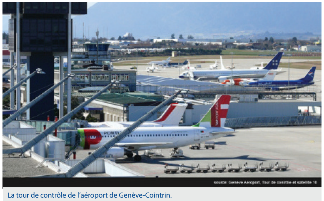
La tour de contrôle de l'aéroport de Genève-Cointrin.